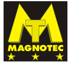
SMD 500 - 24