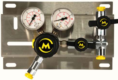
SMD 500 - 25